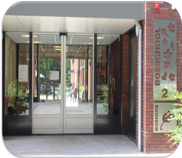
Schoolplan de Bosschool 2019-2023, Kind & Jeugd